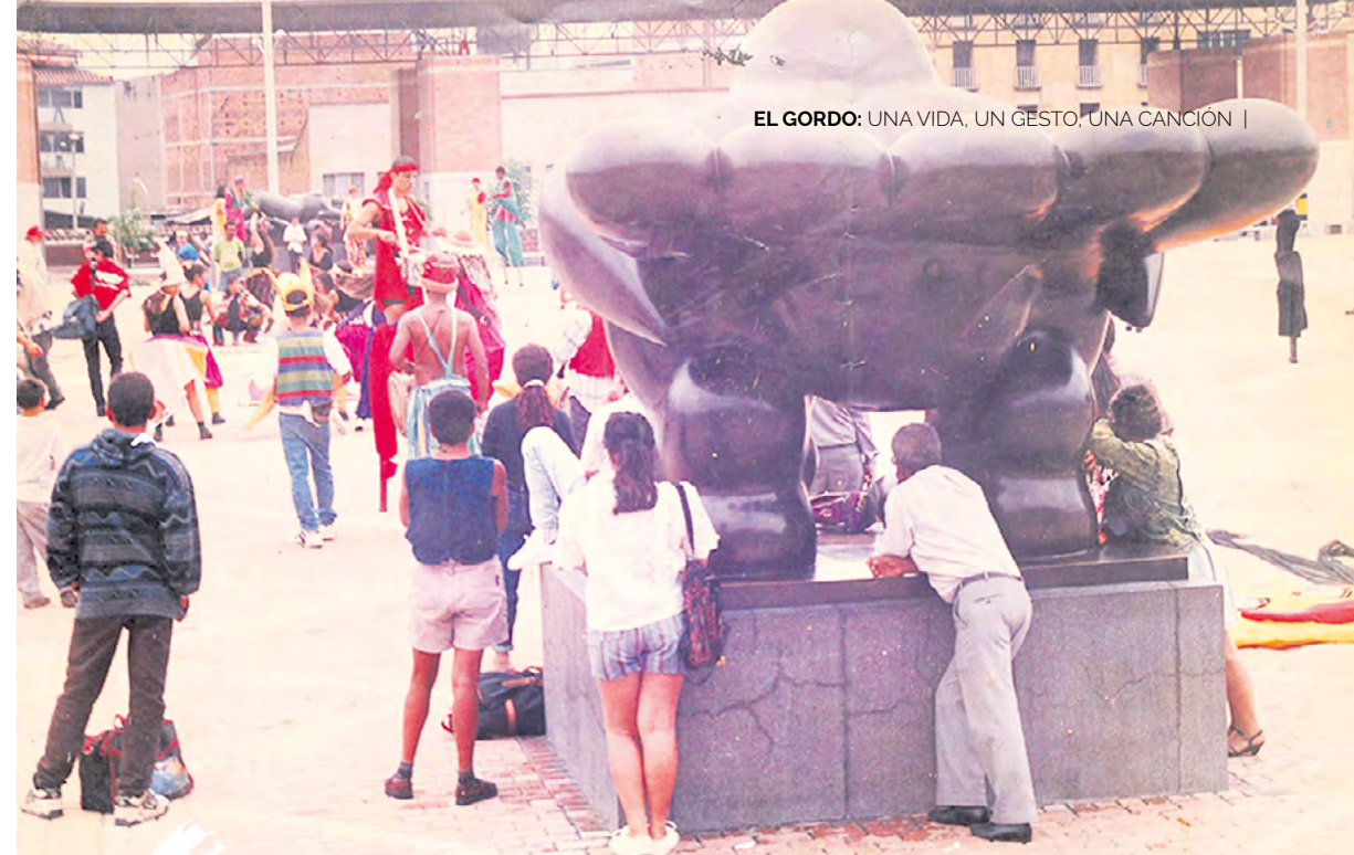
EL GORDO: UNA VIDA, UN GESTO, UNA CANCIÓN |

ra en seis ocasiones cuando el desfile tenía también concurso—; bien contados son veintidós montajes en veintisiete años; El árbol de corazones es la obra más reciente. Han hecho presentaciones en el Festival Iberoamericano de Teatro de Bogotá, el Festival Internacional de Teatro de Manizales, y visitas con arte y juego a pueblos y ciudades de todo el país. Sus creaciones representan un abanico colorido de la cosmogonía y la existencia, la raíz y la tradición que conversan y seducen los sentidos de la comunidad y el barrio. Treinta y dos integrantes tienen hoy la Comparsa, así como un taller permanente de creación; la cifra de cuántos han pasado por su escuela o cuántos grupos de la ciudad se han inspirado en ella es difícil, pero probablemente enorme.