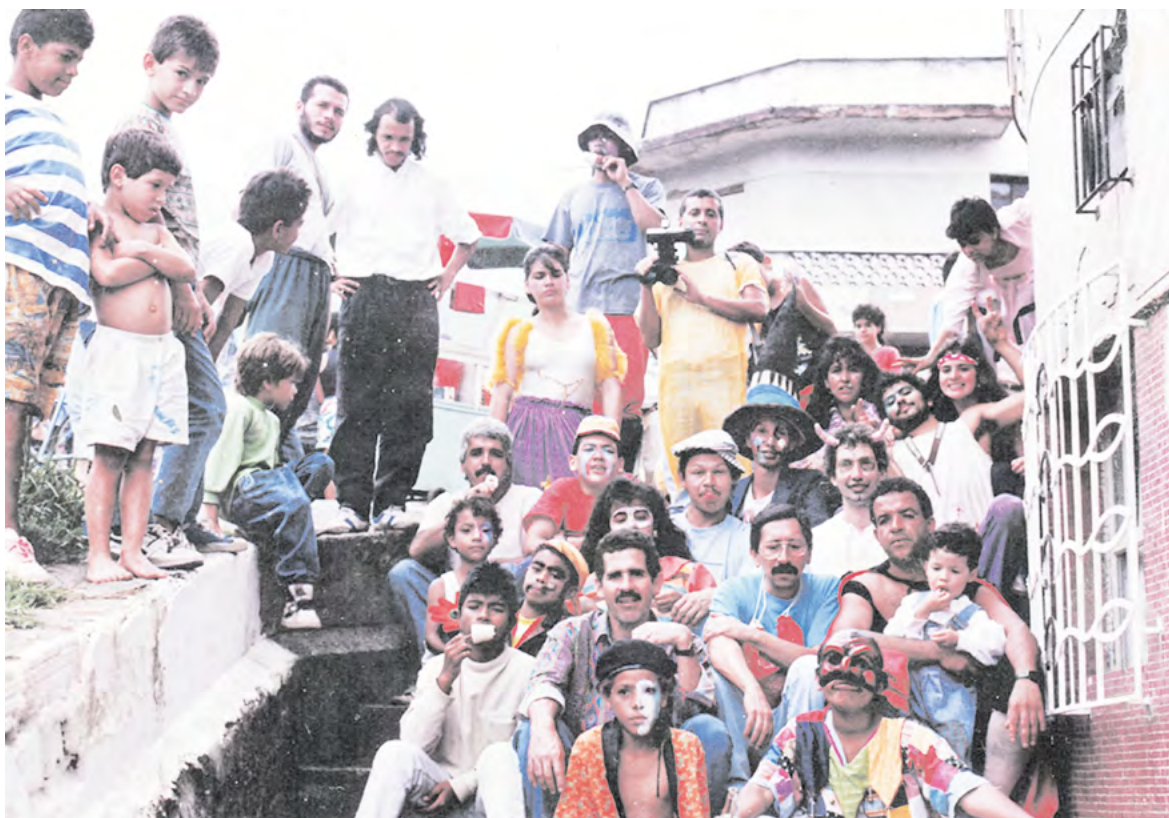
Comparsas en 1991.

La otra lucha era con la politiquería. La cultura es una herramienta maravillosa para entrar con confianza a tratar los temas del territorio, pero si nuestras organizaciones son excluidas y no se reconocen esos procesos, se agotan, se revientan y uno se desanima. La política es cíclica, cada cuatro años, un tiempo para un plan de desarrollo, una estrategia, unas promesas, diría